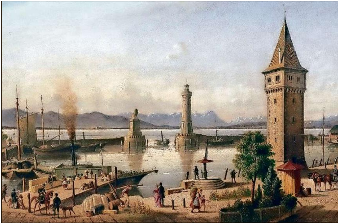
Lindau ha furmà in impurtant lieu da commerzi per las Trais Lias e per il traffic da transit tranter la regiun al Lai da Constanza e la Lombardia. Maletg dal 1882.