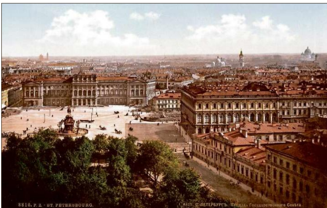
La citad da Son Petersburg ils onns 1890.

Il LIR cumpiglia bundant 3100 artigels (geografics, tematics, artigels da famiglias e biografias) davart l'istorgia grischuna/retica e la Rumantschia. Editura: Fundaziun Lexicon Istoric Svizzer; versiun online: www.e-lir.ch ; versiun stampada: www.casanova.ch u en mintga libreria.