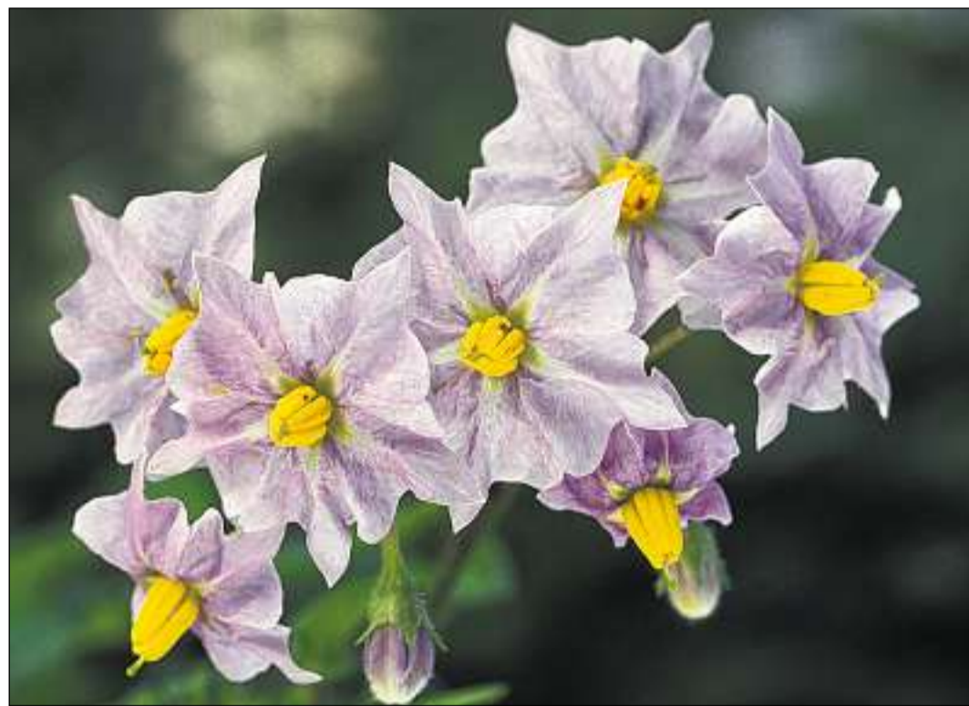
Per ils conquistaders ina bellezza exotica, oz savens survesida: la planta da tartuffel en fluriziu.