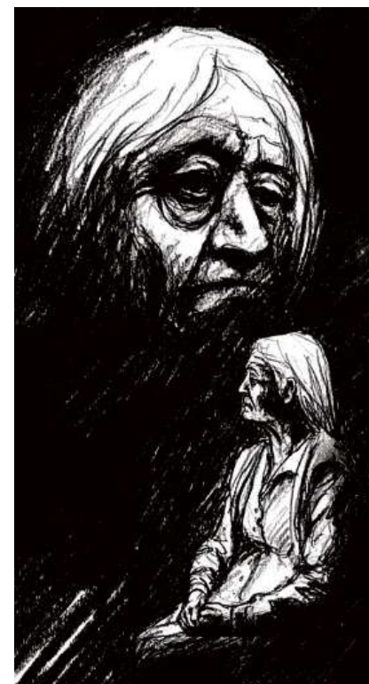
Snuizi e sgarschur en la publicaziun «La feglia dal fraissen» da Viola Cadruvi – cun illustraziuns da Jon Bischoff.