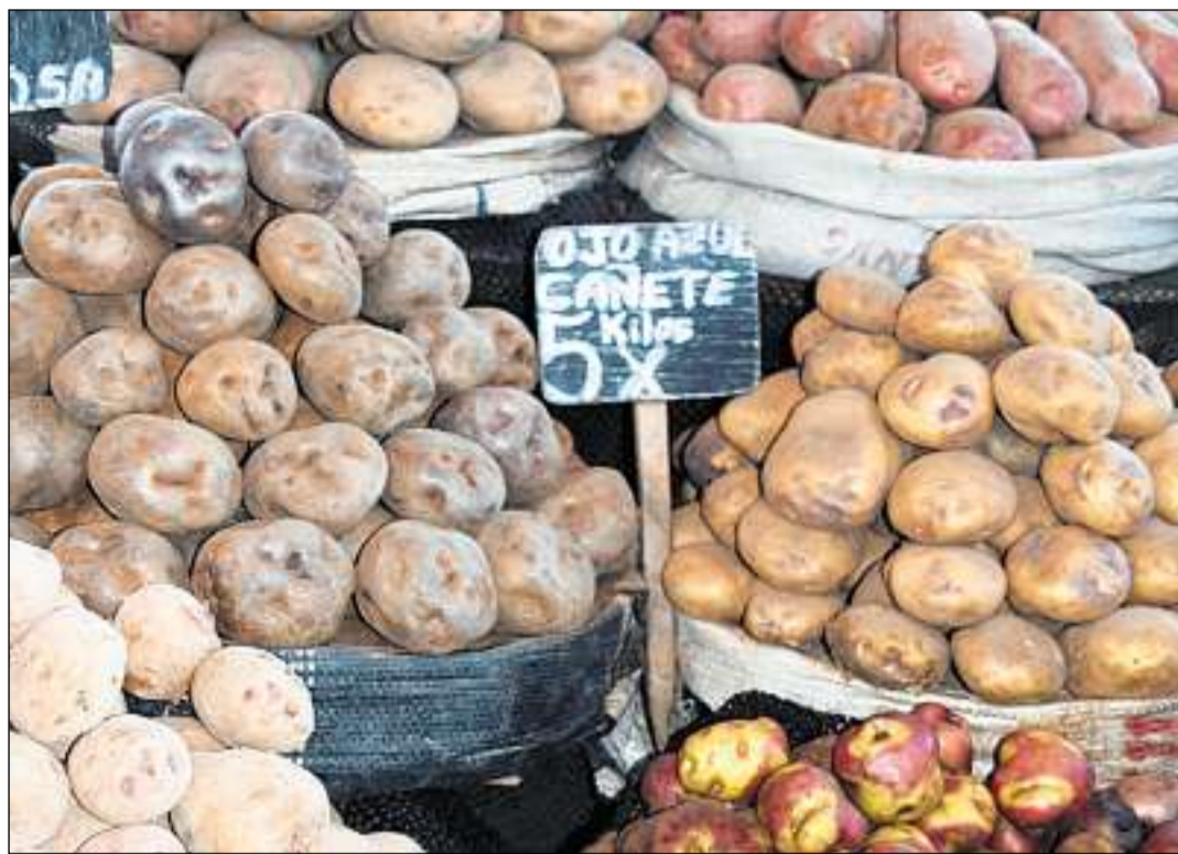
Nua che tut ha cumenzà: tartuffels originars sin in martgà a Peru.