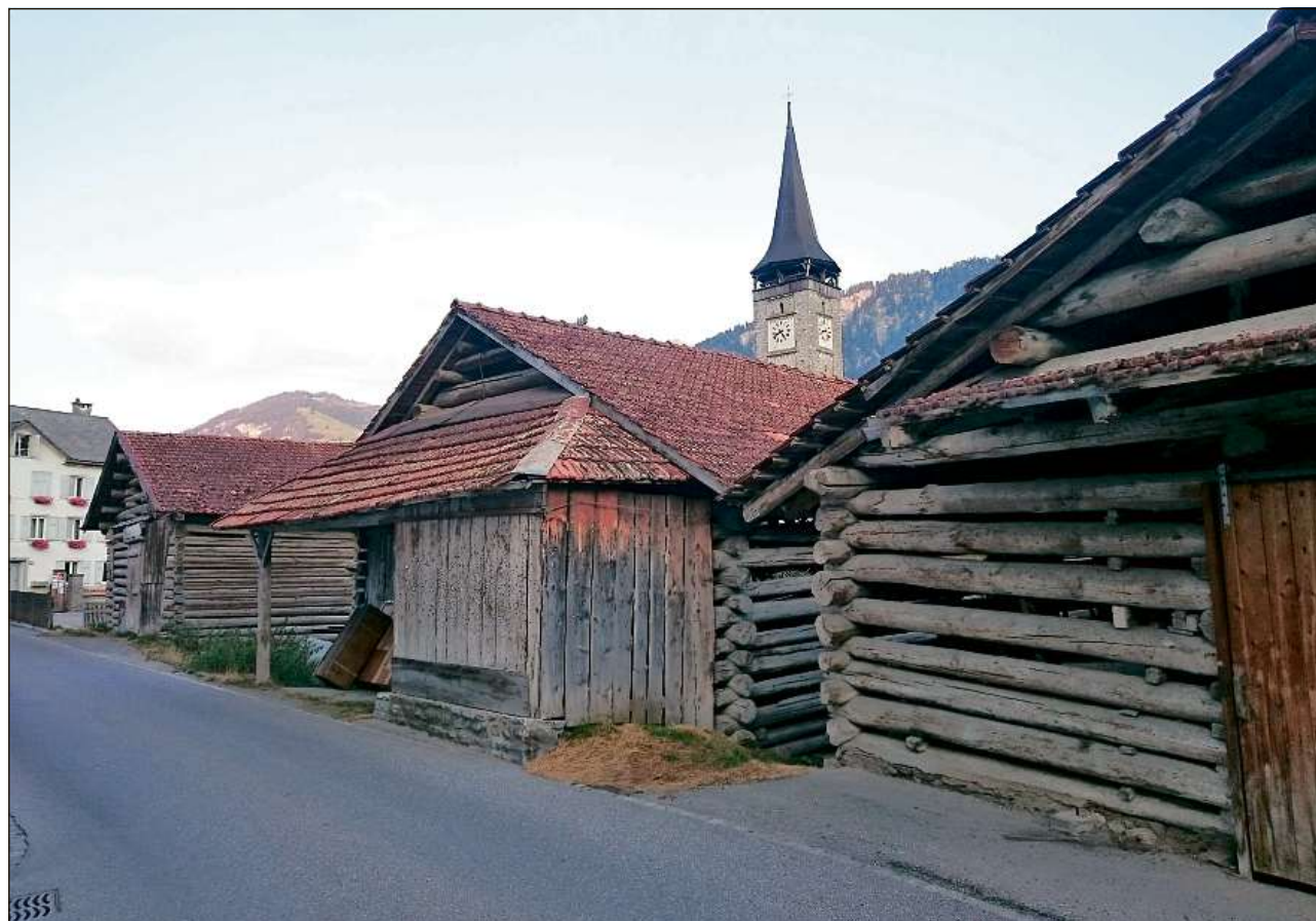
Il Tribunal federal ha finalmain dà glisch verda per la construcziun d'ins susta amez Sagogn.

Sentenzia 1C_340/2017 dals 25 da zercladur 2018, publitgada ils 20 da fanadur 2018