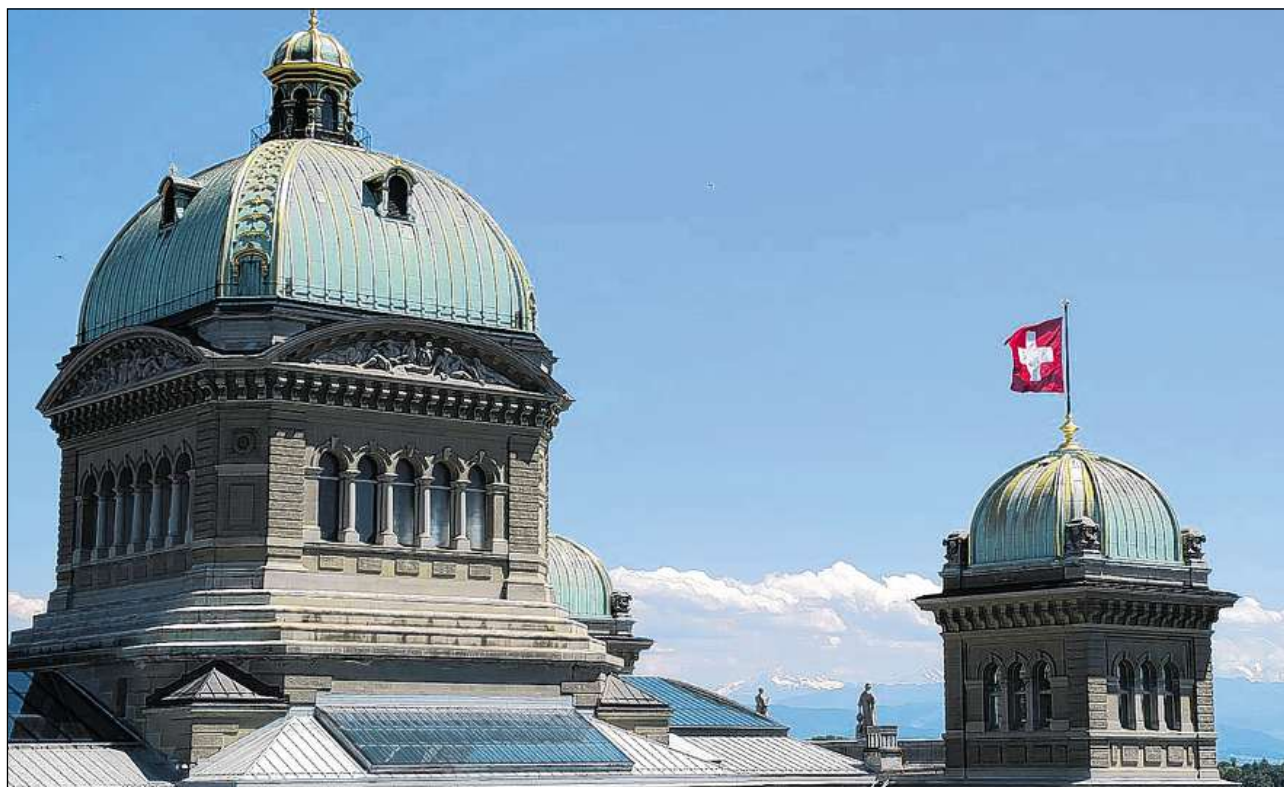
Quest glossari tracta 135 terms essenzials dal sistem politic svizzer.