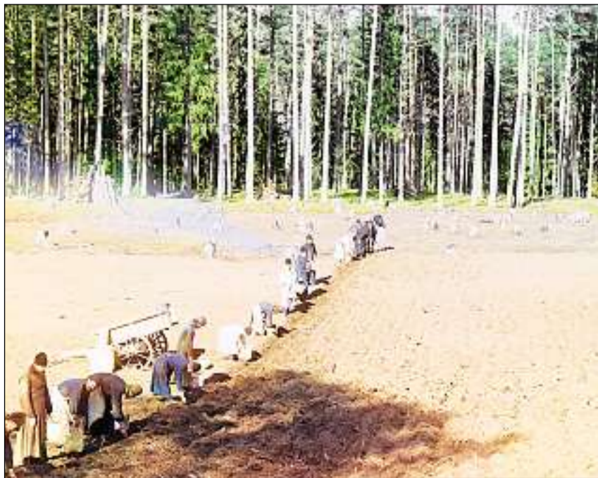
Cultivaziun da tartuffels en la Russia zaristica, ca. 1910.

Il tartuffel è dentant anc blier pli universal che quai ch'ins pensa e na serva betg mo sco mangiativa: Cun laschar fermentar ils tartuffels pon ins per exempel producir alcohol. Or da quel vegn fatg vinars da tartuffels ed ina varianta da vodka (sper la varianta principala fatga cun graun). L'amet cuntengnì en il tartuffel fa plinavant daventar liquids in pau pli consistent u perfin dirs. Quai vegn tratg a niz tant en l'industria d'alimentaziun (tar sosas, schuppa, fondue, puding, ursets da gomma) sco tar la producziun da palpi, chartun e collas.